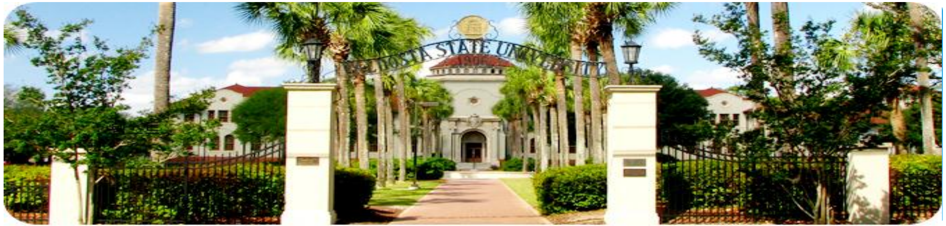
Valdosta State University, West Hall