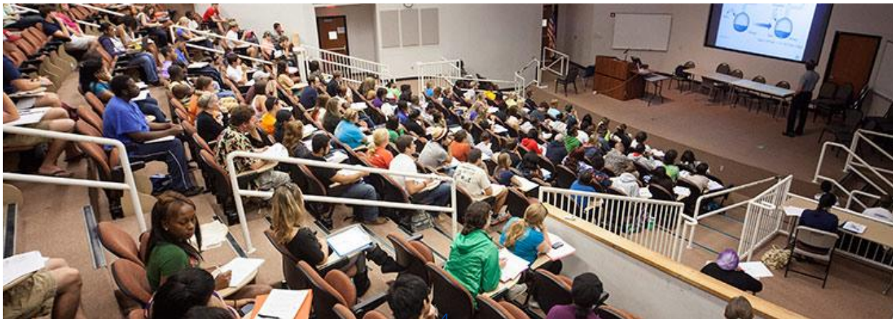
Một lớp học tại ĐH Valdosta