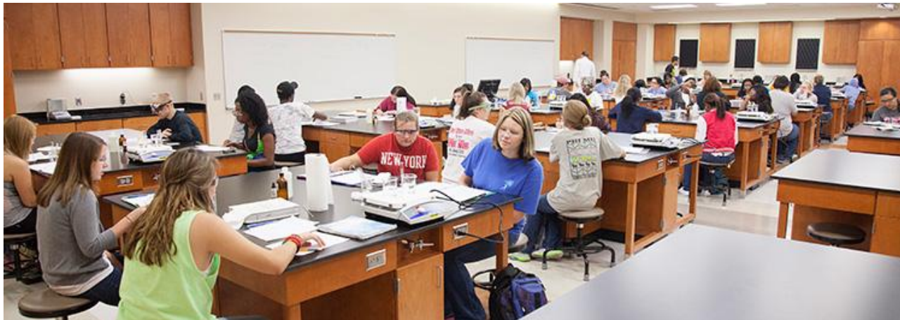
Một góc sinh viên ngành QTKD ĐH Valdosta – Georgia – Hoa Kỳ