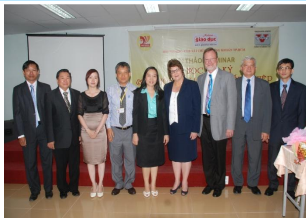
Ban TC cùng ĐH Valdosta, Hoa Kỳ Tại Hội thảo tháng 9/2011 – TP.HCM